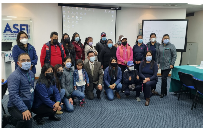
El Director General Ejecutivo de ASFI junto a miembros del Colectivo Hormigón Armado.