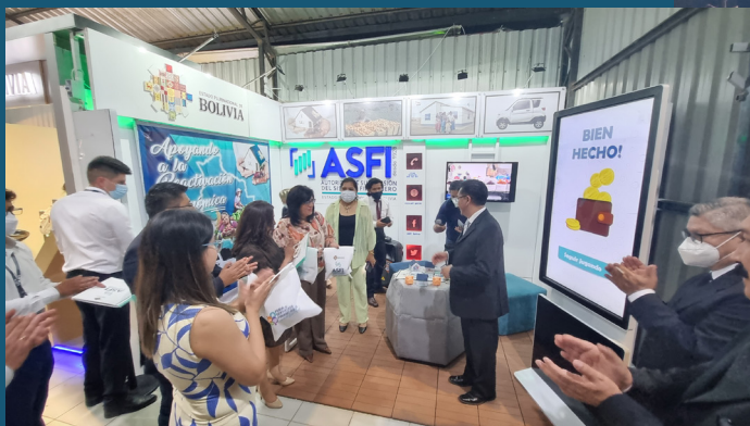
Stand de ASFI recibe la visita de autoridades y participantes a la Feria.