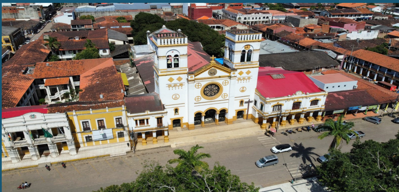
Vista panorámica de la Catedral de Trinidad

La Autoridad de Supervisión del Sistema Financiero (ASFI), una de las entidades organizadoras de esta actividad, atendió en su stand consultas relacionadas a créditos destinados a la compra de una vivienda de interés social, financiamiento para el sector productivo y otras temáticas relacionadas con la normativa aplicable al sector financiero y, principalmente, la emisión de Certificados de Información Crediticia. Adicionalmente, también se recibieron reclamos de personas sobre algunos casos contra entidades financieras.