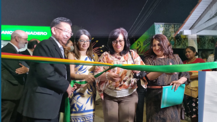
Autoridades realizan el corte de cinta para inaugurar la Feria de Servicios Financieros para el Vivir Bien en Trinidad