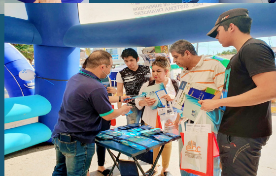
Servidores públicos de ASFI atienden reclamos, consultas y entregaron Certificados de Información Crediticia (CIC),