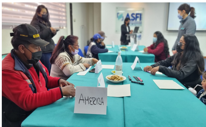
Miembros del Colectivo Hormigón Armado realizan dinámicas grupales

El Colectivo Hormigón Armado, trabaja para defender y resaltar la dignidad del oficio de lustrar zapatos, buscando a través de sus actividades dignificar la actividad, buscando la comprensión y solidaridad de la sociedad. En lo que respecta a sus objetivos, el principal es reforzar la autoestima de sus integrantes, dotándoles de apoyo conjunto para el logro de sus aspiraciones personales.